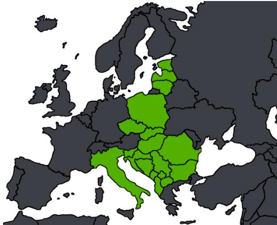
Areas affected by African Swine Fever