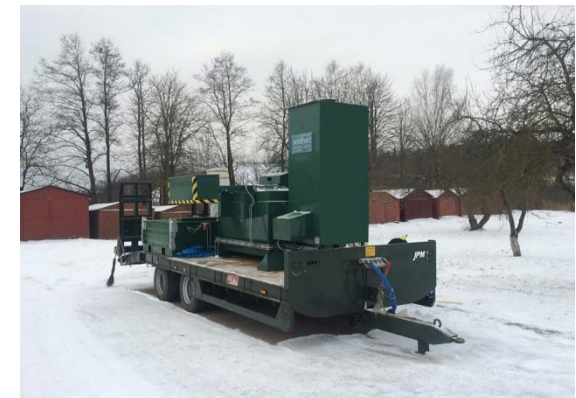
Mini Plus Mobile de Addfield

información clara en torno a este tema que se puede ver por el bajo nivel de conciencia visto en las personas fuera de la industria en la cría de cerdos. Otros factores más obvios incluyen la libertad del jabalí, el movimiento ilegal de animales y el transporte de mercancías contaminadas en vehículos.